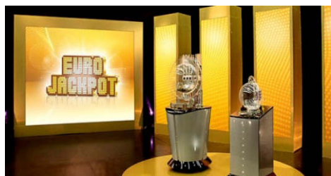
Abb.: Die EuroJackpot-Ziehung in Helsinki

Wenn die Garantieverhältnisse von Systemen berechnet werden, entstehen oft hunderte und manchmal tausende von verschiedenen Trefferfällen. Die alle zu publizieren wäre total unübersichtlich. In diesem Buch wurden deshalb die Gewinnfälle nach einem strengen Prinzip zusammengefasst, ohne jedoch die Aussagekraft zu schmälern. So werden bei jeder Anzahl richtiger Gewinnzahlen die dabei vorkommenden Trefferfälle aufgrund des jeweiligen höchsten Rangtreffers zu einem Trefferfall komprimiert. Für jeden Trefferfall wird selbstverständlich ausgewiesen, wie hoch die prozentuale Chance ist. Trotz dieser kompakten Darstellung wird pro System eine ganze Buchseite benötigt. Die Gewinnfälle sind zudem unterteilt in Bezug auf richtige Stern- bzw. Eurozahlen.