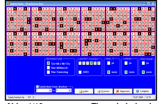
Abb.: 1/10mm genauer Tippscheindruck