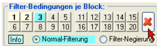
Abb.: Schalter für das Löschen der Filterbedingungen für alle Filterblöcke

Wenn man alle Filterblöcke für den Tippzeichen-Filter oder Grundtipp-Filter löschen möchte, klickt man auf den Schalter mit dem roten Kreuzchen, der sich am oberen Rand in der Blockauswahl befindet. Vor der tatsächlichen Löschung erscheint noch eine Sicherheitsabfrage.