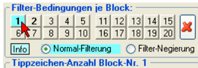
Abb.: Der 1. Filterblock ist ausgewählt