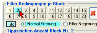
Abb.: Der 2. Filterblock ist ausgewählt