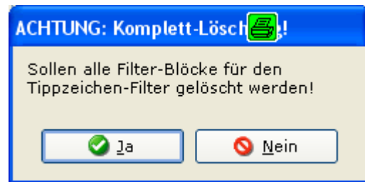
Abb.: Sicherheitsabfrage vor dem Löschen aller Filterblöcke