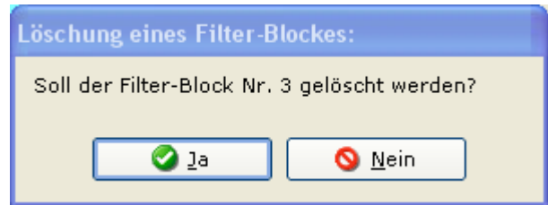
Abb.: Sicherheitsabfrage vor der Einzelblock-Löschung