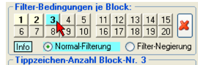
Abb.: Der 3. Filterblock ist ausgewählt

In den Rahmenüberschriften der einzelnen Filter steht auch die Block-Nummer, z.B. " Tippzeichen-Anzahl Block-Nr. 1 ". Pro Filterblock kann festgelegt werden, ob es sich um eine Normal-Filterung (Voreinstellung) oder um eine Filter-Negierung handelt.